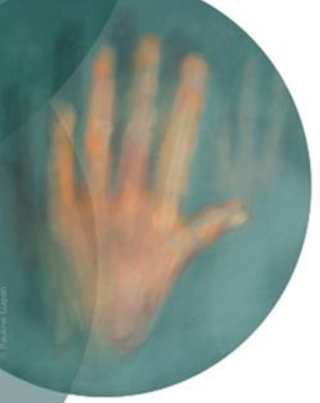
Abb. 1 Eine Typologie der Gewalt